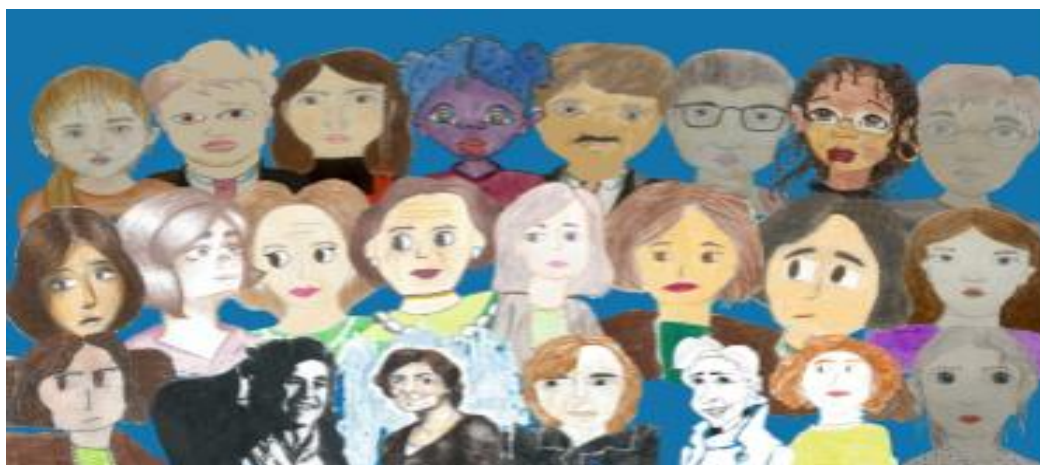
Imagem 1- Pinturas feitas por alunos, 2026